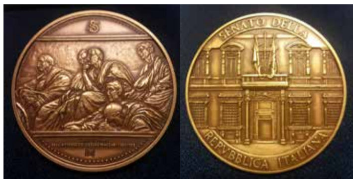
Medaglia del Senato della Repubblica