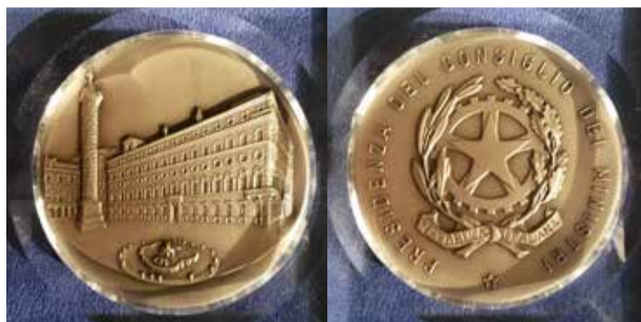
Medaglia del Consiglio dei Ministri